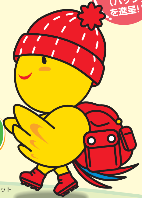
防災マスコット はばタン